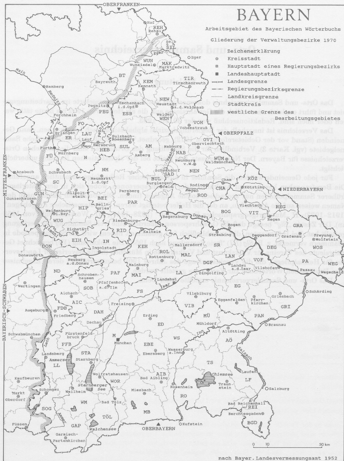
Karte 1: Arbeitsgebiet, Grundkarte mit Verwaltungsgliederung vor der Gebietsreform von 1972.