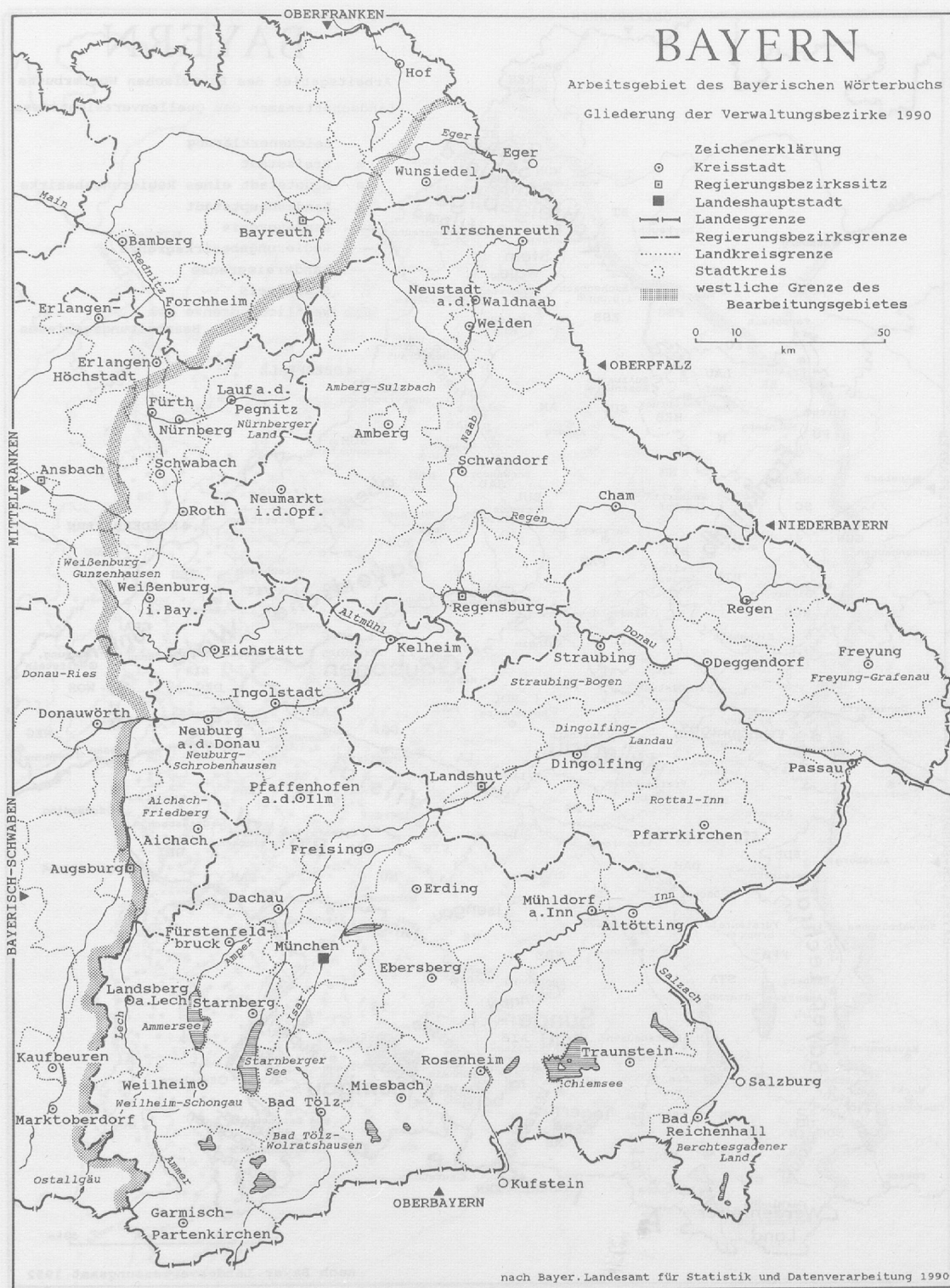
Karte 2: Arbeitsgebiet mit Verwaltungsgliederung 1990.