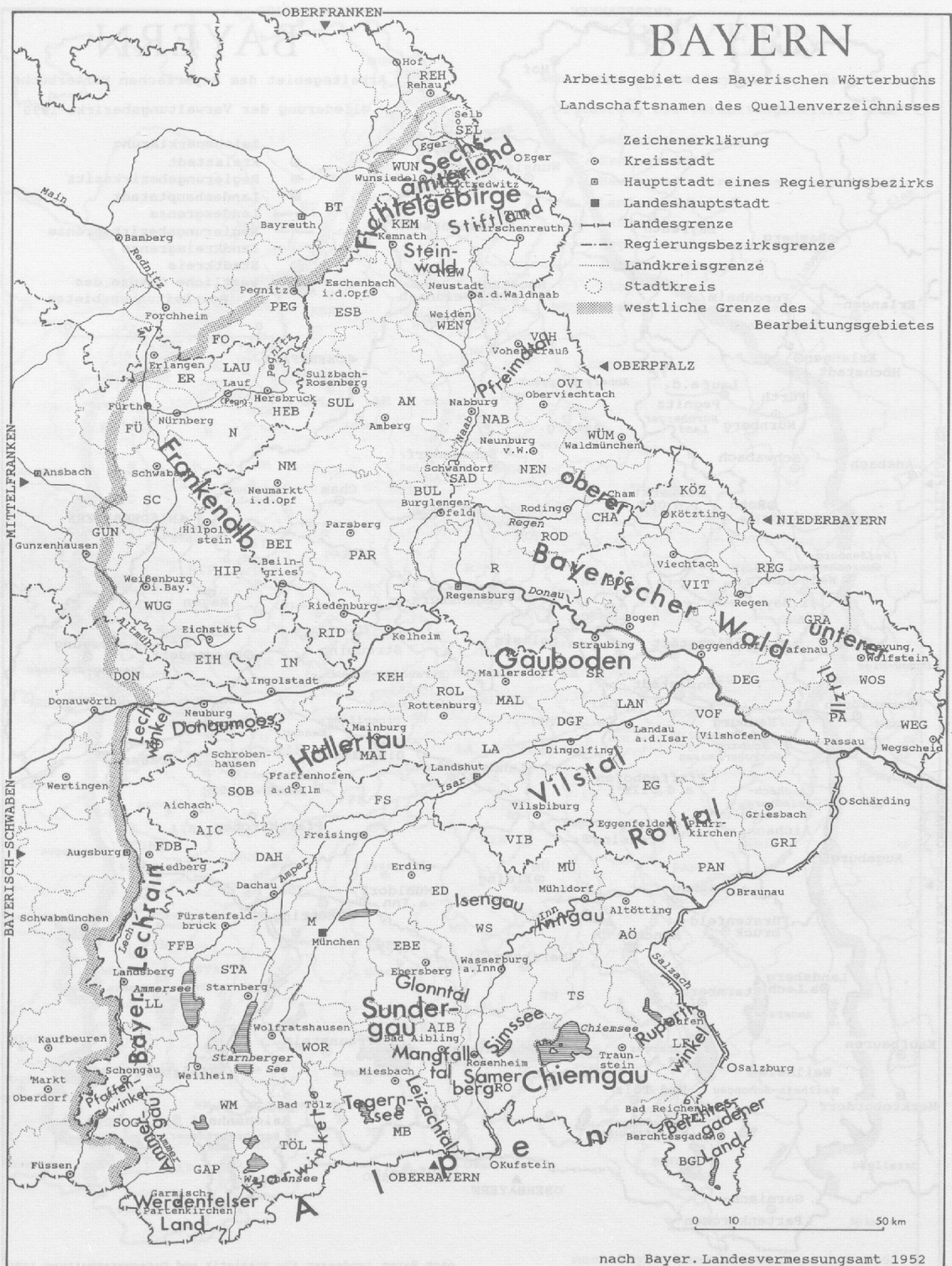
Karte 3: Gebietsnamen