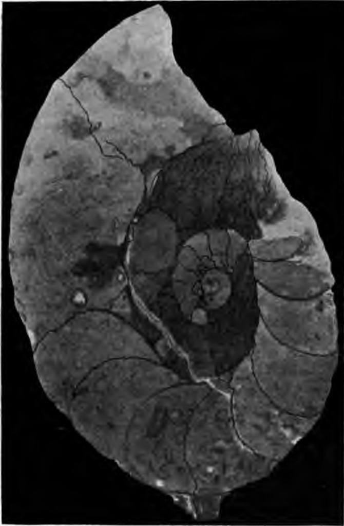
Medianer Längsschnitt durch einen Ammoniten von Ruhpolding in natürl. Grösse nach photograph. Aufnahme. Nur die Drucksuturen und Septen sind durch Ueberzeichnung etwas deutlicher gemacht.