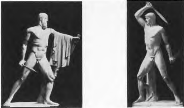
Abb. 2. (Dresden)

gegen den Beschauer zu, entladen zu lassen, stehen andere gegenüber, die in klarer Erkenntnis des flächigen Aufbaus der beiden Figuren die Hauptbewegung vor dem Beschauer vorüberführen. Dies konnte auf zwei Arten geschehen, in Gegenüberstellung und in Gleichrichtung der beiden Figuren. Die