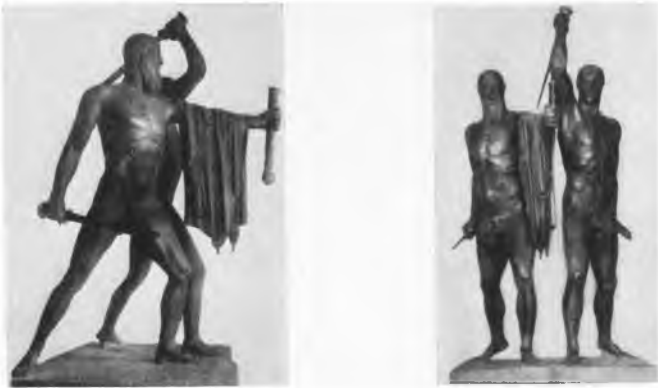
Abb. 1. (Braunschweig)

(Der schöne Mensch 2 S. 170 f.), Schweitzer (Pasquino S. 69) haben sie empfohlen, und so ist sie auch die Lieblingsaufstellung der Abgüßmuseen geworden. Ja sogar die Marmorstatuen des Neapler Museums wurden nach diesen Vorschlägen aufgestellt (Richter, Sculpture Fig. 571; L. Curtius, Antike Kunst II Abb. 189; Bull. com. 58, 1930, S. 121).